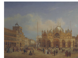
Виктор Адам «Виды Венеции»