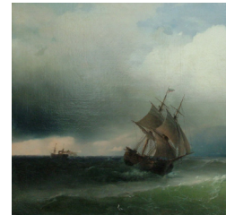
И. К. Айвазовский «Приближение бури»