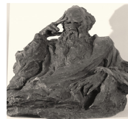
А.С. Голубкина «Л.Н. Толстой».