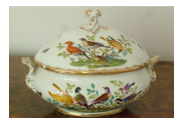
Супница. Фарфор. Германия. XIX в.

Продажа абонемента – с 1 сентября по адресу: ул. Ф. Энгельса, 64 (Туйский областной художественный музей)